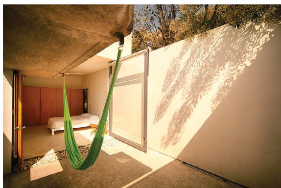
Los acabados de madera siguen la línea natural de los materiales.