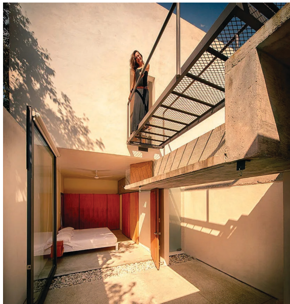
Un andador de metal rompe con la estructura simple de la casa.