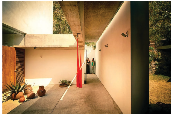
La monotonía de los colores tierras se rompe con acentos de color como macetas, textiles y las hamacas.

Tags México Naturaleza Decoración Diseño Interior Mobiliario Arquitectura